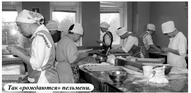
Так «рождаются» пельмени.

Побеседовав, мы идем знакомиться с производством. Предприятие разместилось на двух этажах помещения, бывшего когда-то солдатской столовой. Поэтому особо ничего менять и не пришлось. На втором этаже сделан ремонт, начаты работы на первом. В производственных помещениях его делать сложно: во-первых, нельзя прерывать процесс изго-